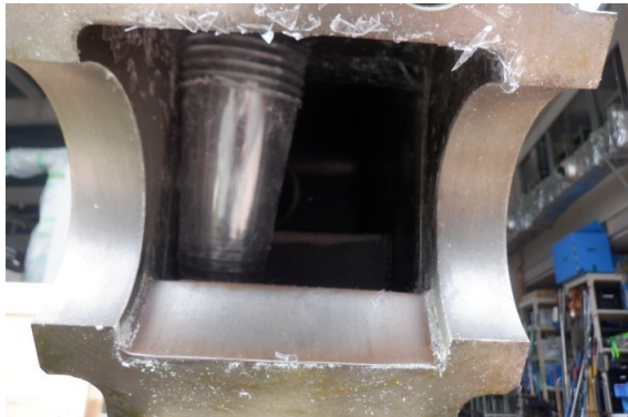
跳ねて隙間に挟まる(粉碎できない)