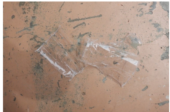
コップ個々投入 大きく粉碎されている。 粉碎より破砕で、減量には、余り効果なし