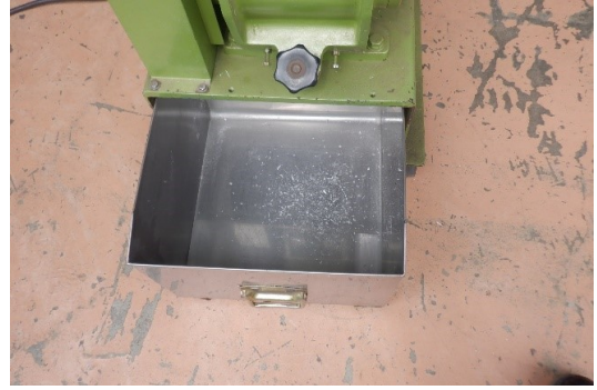
コップ単品投入 殆ど粉碎されない