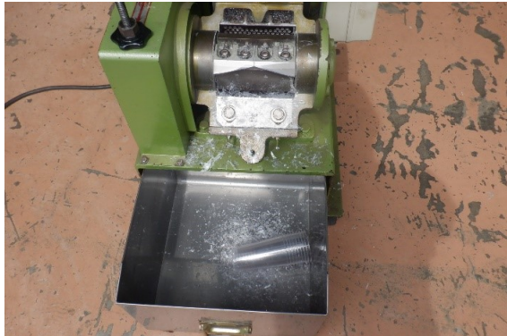
コップを重ねて投入 粉碎できない